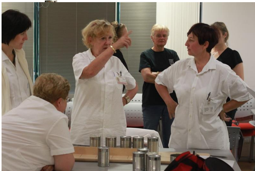
Setkání zástupců EDC FN Ostrava a KrP ÚP ČR Moravskoslezského kraje

Klinika léčebné rehabilitace je akreditovaným pracovištěm pro erudici lékařů v oboru RFM. Pracovníci kliniky se podílejí na pregraduální výchově studentů Ostravské univerzity. Klinika organizuje postgraduální kurzy pro fyzioterapeuty a ergoterapeuty z celé ČR.